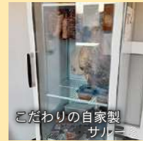
こだわりの自家製サルーミ

〒006-0031 札幌市手稲区稲穂1条4丁目8-10 Tel: 011-838-8498 メール: parco.fiera.sapporo@gmail.com 定休日: 日曜日、不定休 ランチ: 11:30 ~ 13:00 (L.O) デイナー: 18:00 ~ 21:00 (L.O) ※ディナーは1日2組(1組1名~10名様まで)の完全予約制 ※テイクアウトメニュー有 詳しくはHPをご覧ください https://www.parcofiera-sapporo.com/