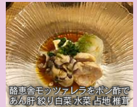
酪恵舎モッツアレラをポン酢で あん肝 絞り白菜 水菜 占地 椎茸

酪恵舎のモッツアレラは、なめらかでジューシー。ポン酢の酸味がミルク感をより一層引き立てます。これからの季節にピッタリの爽やかな一品です♪合わせた日本酒は、福島県の大木代吉本店「楽器正宗本醸造中取り」。この日本酒は甘旨ジューシーで、甘酸のバランスが優れた、スーパー本醸造と名高い日本酒です。モッツアレラのミルクの甘味とポン酢の酸味が見事に調和し、素晴らしいハーモニーを生み出します。花冷え(10℃)~涼冷え(15℃)で、ガラス製のお猪口やワイングラスで飲むのがおススメです♪キリッと冷やしたシャンパングラスで、人気急上昇中のスパークリング清酒である「大信州純米吟醸スパークリング」や「紀土スパークリング純米大吟醸」と合わせても◎白糠酪恵舎のモッツアレラはコンテで大人気のチーズです♪ぜひ一度お試しください☆