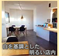
白を基調とした明るい店内