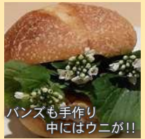
パンも手作り 中にはウニが!!