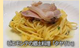
ピエモンテの郷土料理「タヤリン」