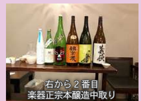
右から2番目 楽器正宗本醸造中取り

おばんざいと和食 風香(ふうか) 札幌市中央区大通西16丁目2-4 メゾンエクレール近代美術館2階 ~地下鉄東西線 西18丁目駅より徒歩2分~ 電話: 011-795-7978 (要予約)