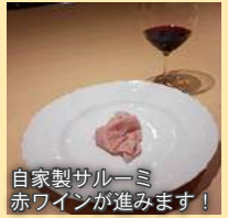
自家製サルーミ 赤ワインが進みます!