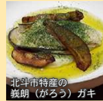
北斗市特産の 義朗(がろう)ガキ